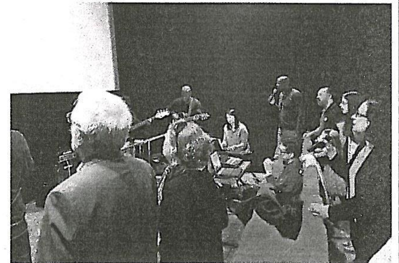
Depuis 2014, le culte protestant a lieu dans l'ancien cinéma le Paradisio, boulevard Ernest-Noël. C'est ce lieu que la communauté protestante va racheter pour en faire son temple.

Quant aux travaux d'aménagement du site, ils pourraient ne pas avoir lieu tout de suite. «Nous ne sommes pas dans une situation d'urgence. Les locaux sont parfaitement adaptés à l'accueil du public, mais manquent simplement de polyvalence», précise le pasteur. Les lieux ne devraient donc pas subir de travaux tout de suite.